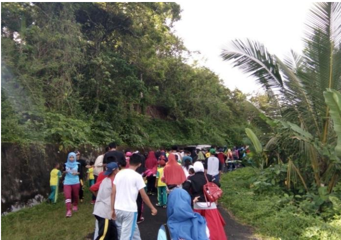
Jalan santai yang dihadiri dengan masyarakat Desa Bonea Timur