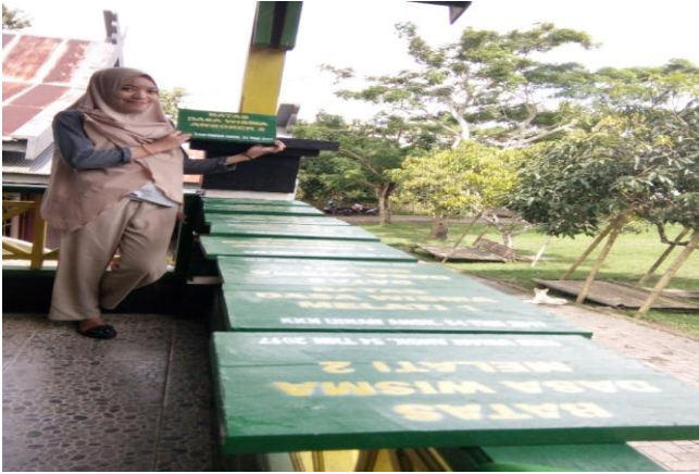
Pengecetan batas dusun dan batas dasa wisma