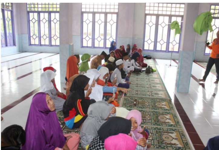
Suasana dalam masjid ketika lomba FASI berlangsung