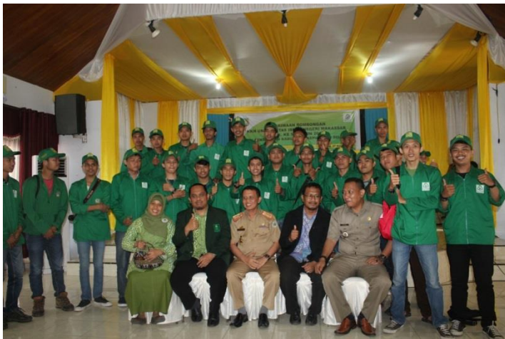
Selasa, 27 maret 2017 foto bersama pemerintah kabupaten kepulauan selayar dengan dosen UIN Alauddin Makassar beserta mahasiswa KKN Angkatan 54