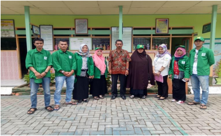
Kamis, 29 maret 2017 kami mngunjungi sekolah SDN Lembang Bau