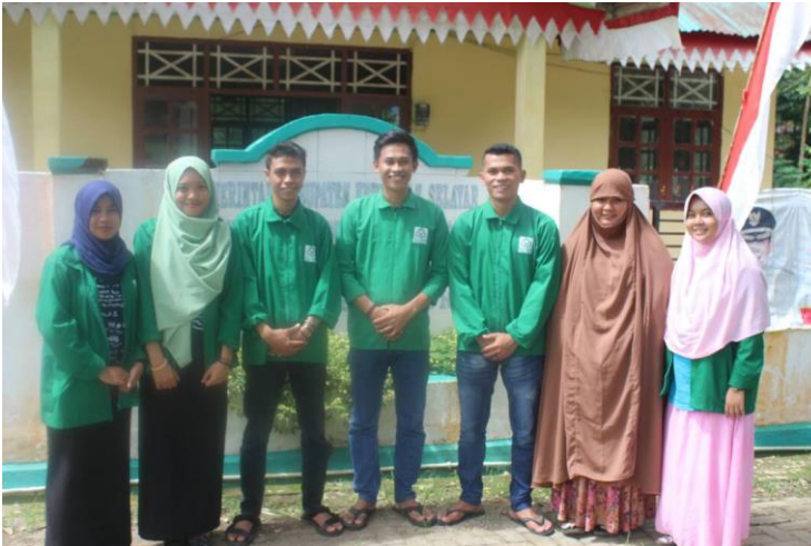
FOTO BARENG APARAT DESA