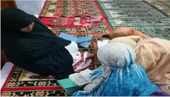
Mengajar mengaji di masjid muhtadin