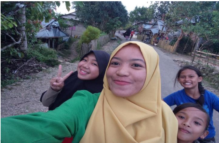
Foto bersama dengan anak-anak setelah kami membersihkan mesjid