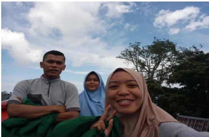
Rabu, 28 maret 2017 survey pertama yang kami lakukan di dusun Lembang Bau