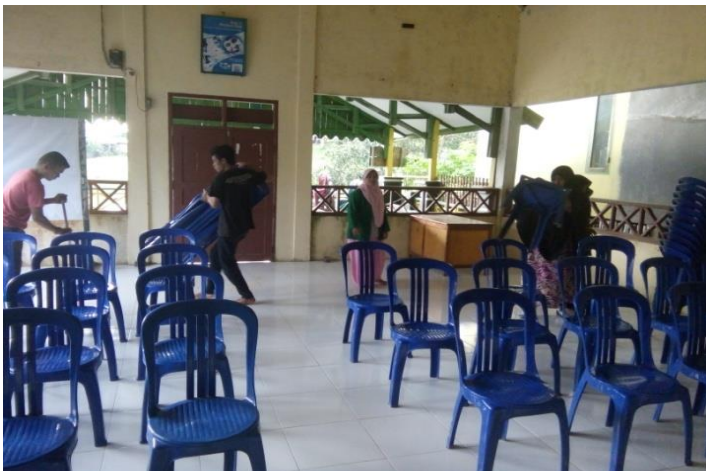
Membersihkan Baruga saying tempat kami melaksanaka seminar desa