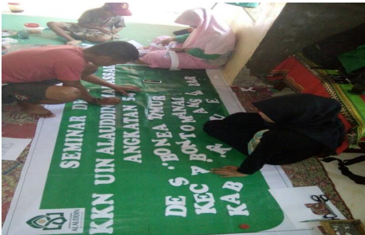
Membuat spanduk unruk seminar desa