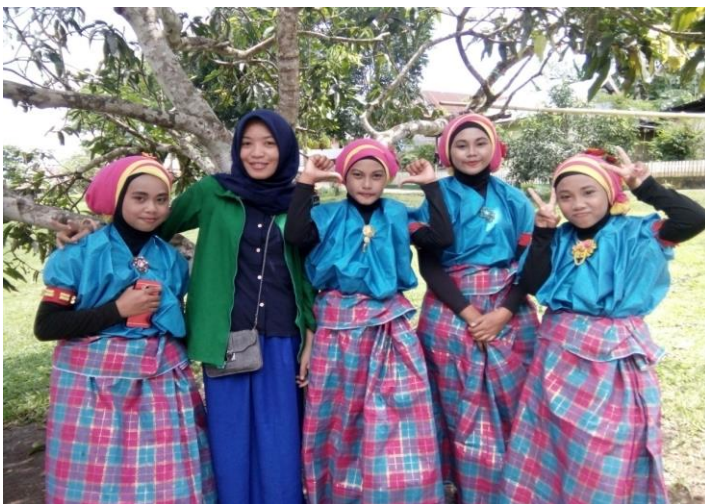
Foto para penari dan kasidah rebana yang dari remaja Desa Bonea Timur