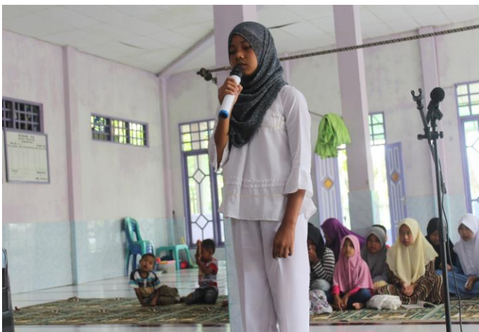
Lomba menghafal surah-surah pendek