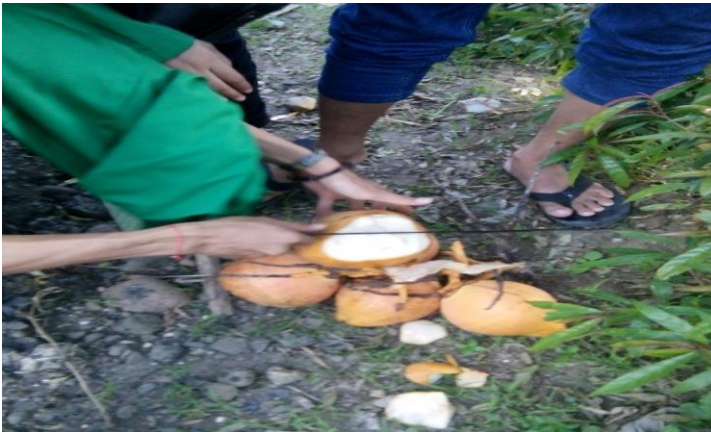
Makan kelapa muda setelah kami membersihkan masjid