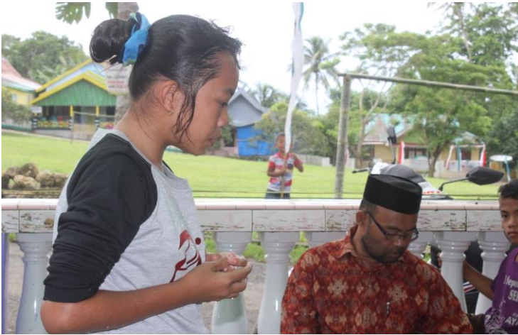
Lomba praktek wudhu