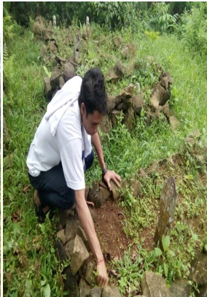
Membersihkan Tempat Pemakaman Umum dan dibantu oleh warga setempat