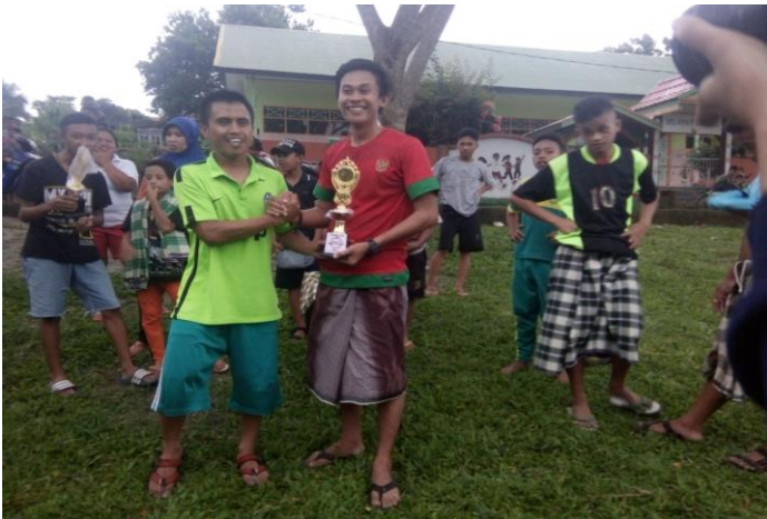
Penerimaan hadiah futsal tradisional dengan memakai sarung