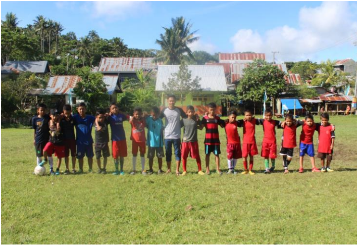
Lomba sepak bola yang dilaksanakan di dusun lembang bau