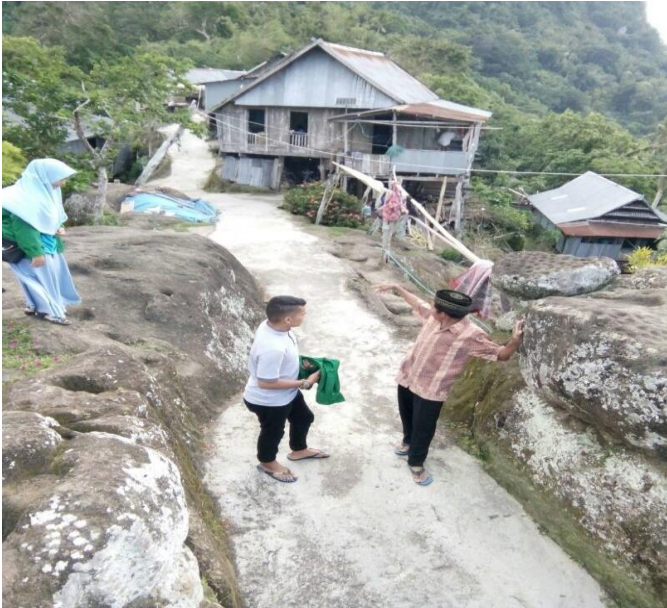
Foto saat melintasi batu keramat di dusun Bissorang