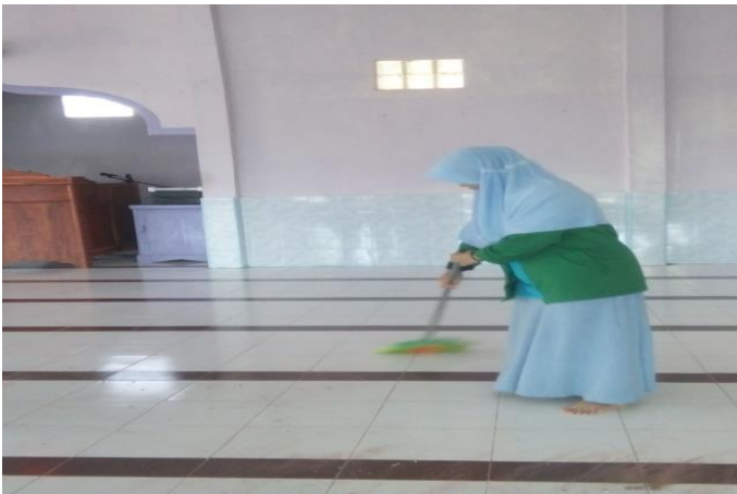
Pembersihan masjid muhtadin di dusin Lembang bau