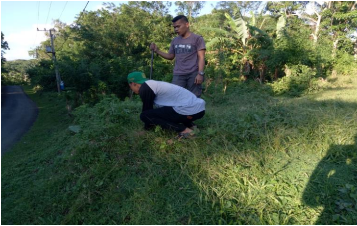
Pemasangan batas dusun dan dasa wisma