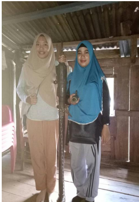
Foto bersama dengan meriam bersejarah