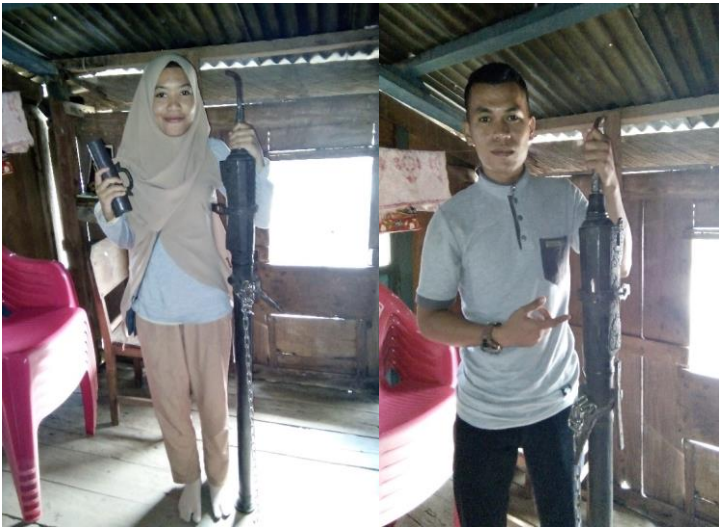
Jumat, 31 Maret 2017 mengunjungi perkampungan tua atau sering disebut dengan perkampungan diatas batu dan masi termasuk wilayah dusun Bissoran