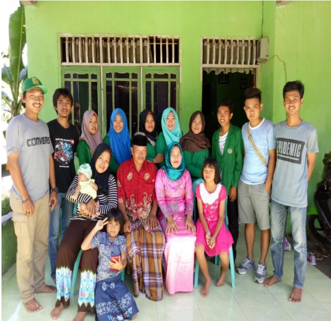
FOTO- FOTO KEGIATAN KKN UIN ALAUDDIN MAKASSAR ANGKATAN 54 DI DESA BONTO CINDE KECAMATAN BISSAPPU KABUPATEN BANTAENG