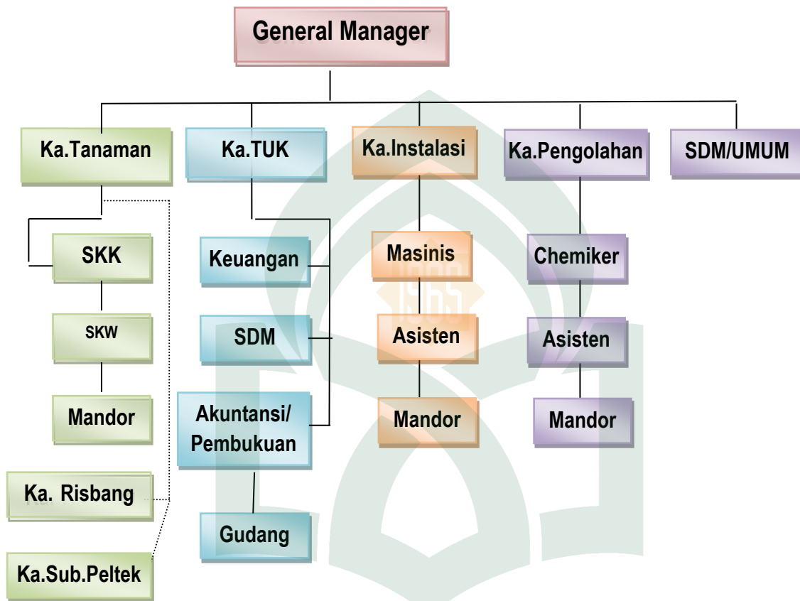
Gambar 4.1 Struktur Organisasi PTPN Persero Pabrik Gula Takalar