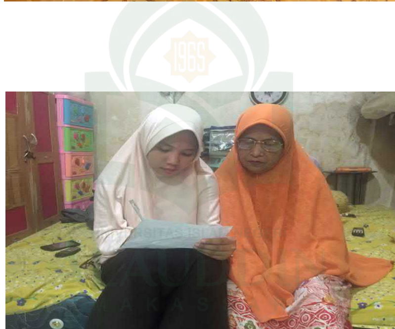
Wawancara dan pengisian biodata oleh orangtua dan remaja di Desa Paraili