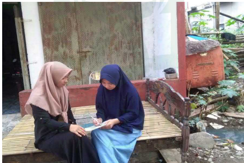
Wawancara dan pengisian biodata oleh remaja di Desa Paraili