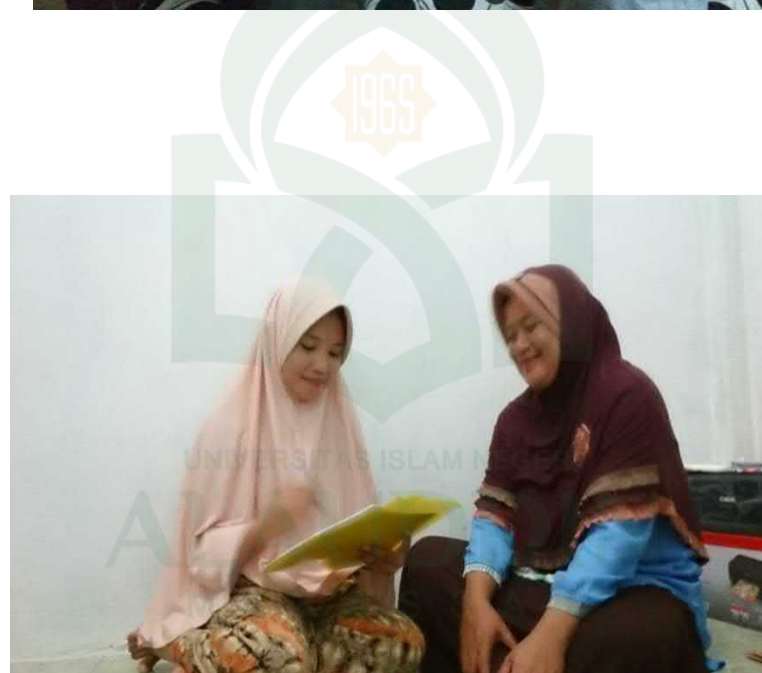
Wawancara dan pengisian biodata oleh orangtua di Desa Paraili