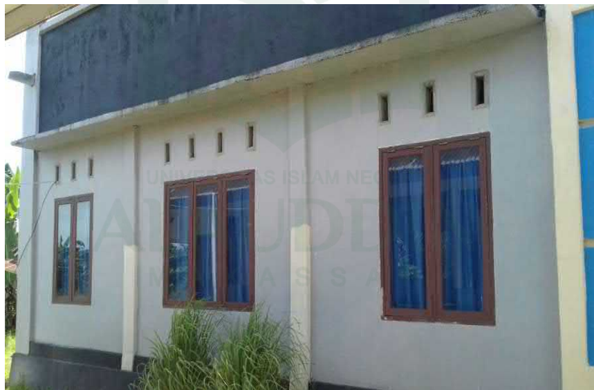
Kantor Desa Paraili