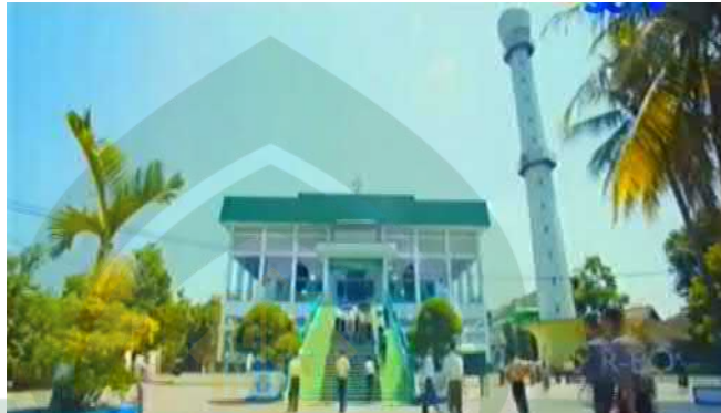
Gambar 4.26: Kebersamaan Alif dan Teman-teman