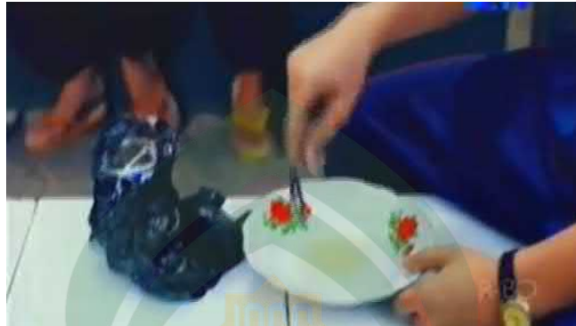
Gambar 4.17: Berbagi makanan