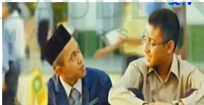
Gambar 4.22: Baso bersama teman-teman