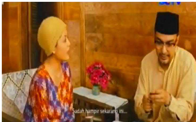
Gambar 4.2: Ayah dan Anak membahas sekolah agama