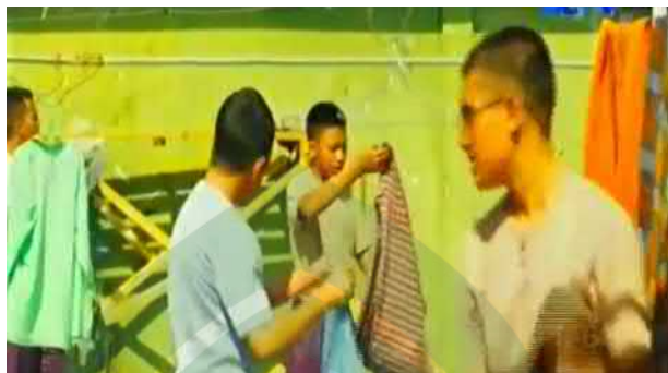
Gambar 4.21: Memberikan semangat