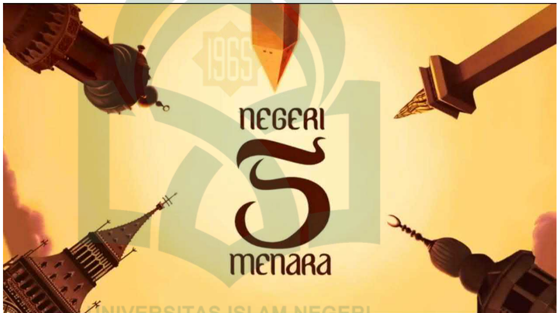
Gambar 4.1: Sampul Film Negeri 5 Menara