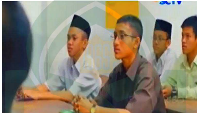
Gambar 4.24: Belajar bersama dikelas