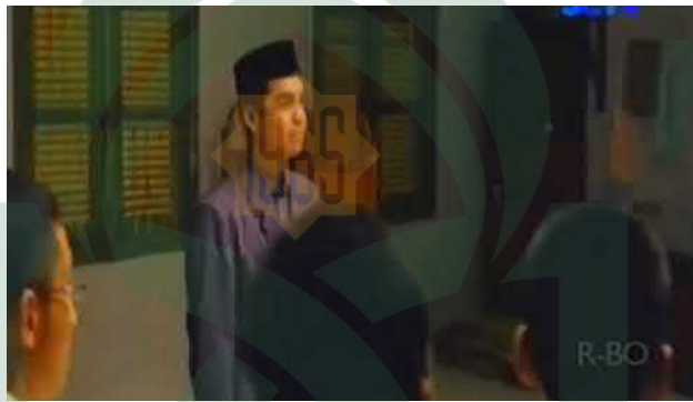
Gambar 4.16: Perkenalan di kelas baru