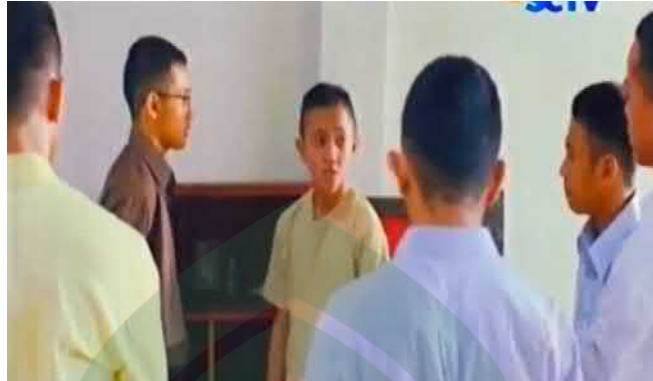
Gambar 4.27: Baso akan menunjukkan foto orang tuanya