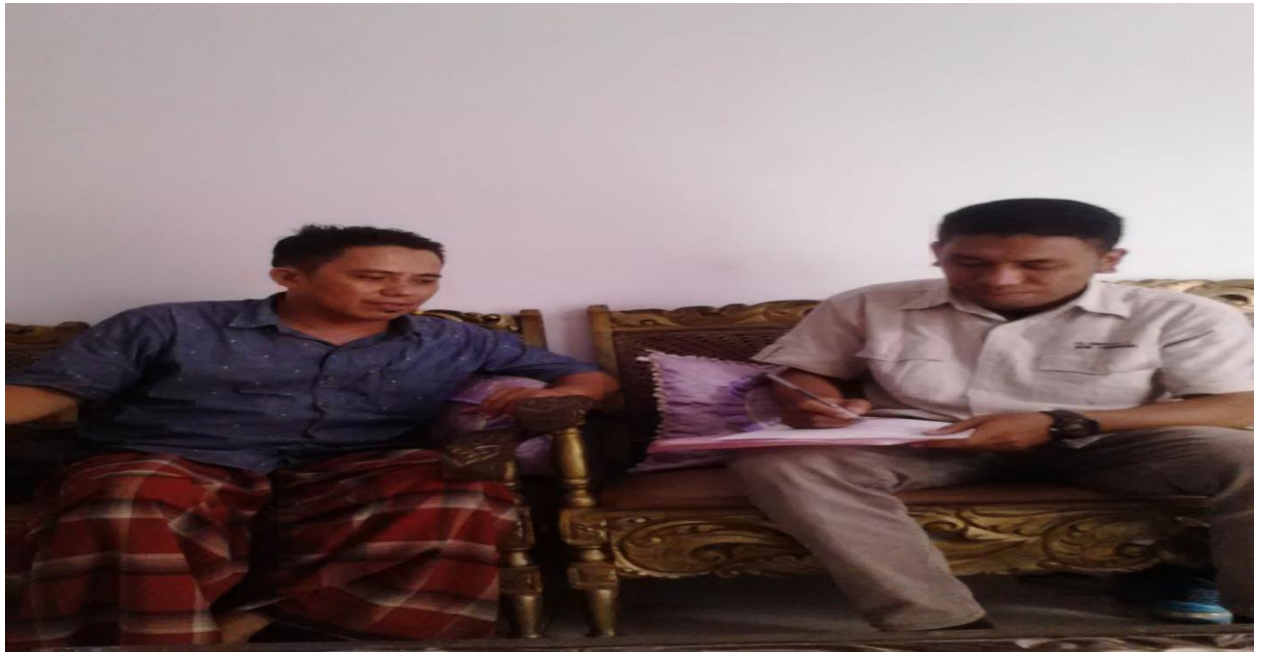
Wawancara dengan Wakil Sekretaris Umum Partai Demokrat Kabupaten Gowa