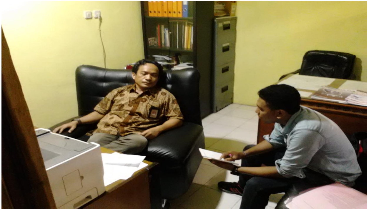
Wawancara dengan Kepala Sub Bagian Teknis Pemilu dan Hupmas KPUD Kabupaten Gowa