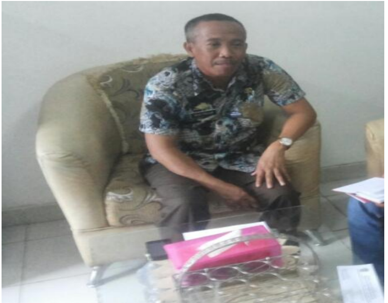
Wawancara dengan kepala bagian Hukum dan Perundang-Undangan Kabupaten Gowa.