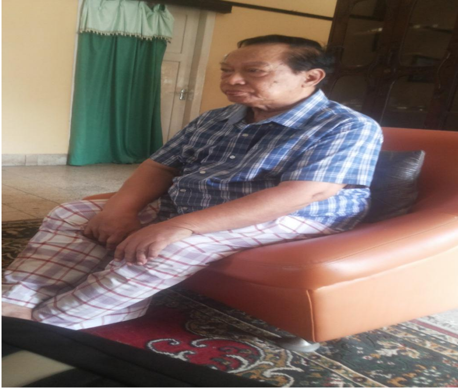
Wawancara dengan Keluarga Kerajaan Gowa.