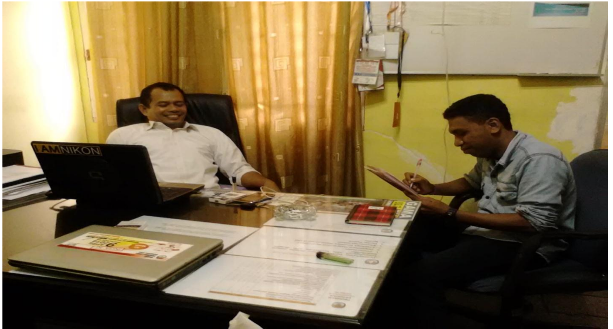
Wawancara dengan Komisioner KPU Kabupaten Gowa Divisi Sosialisasi dan Sumber Daya Manusia.