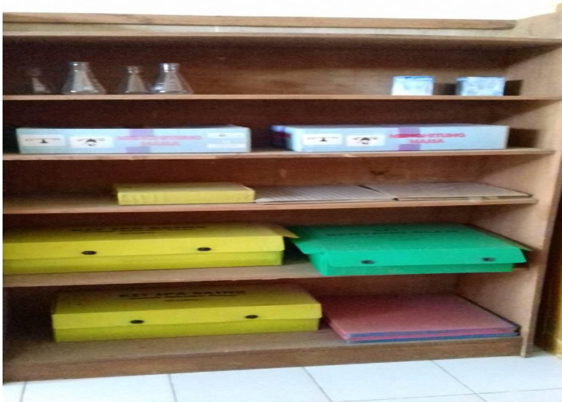
Lampiran 4. Gambar Koleksi Alat Peraga