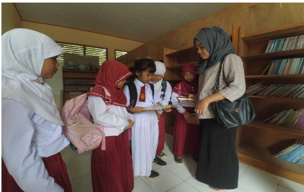
Lampiran 5. Gambar Proses Wawancara Guru dan Siswi