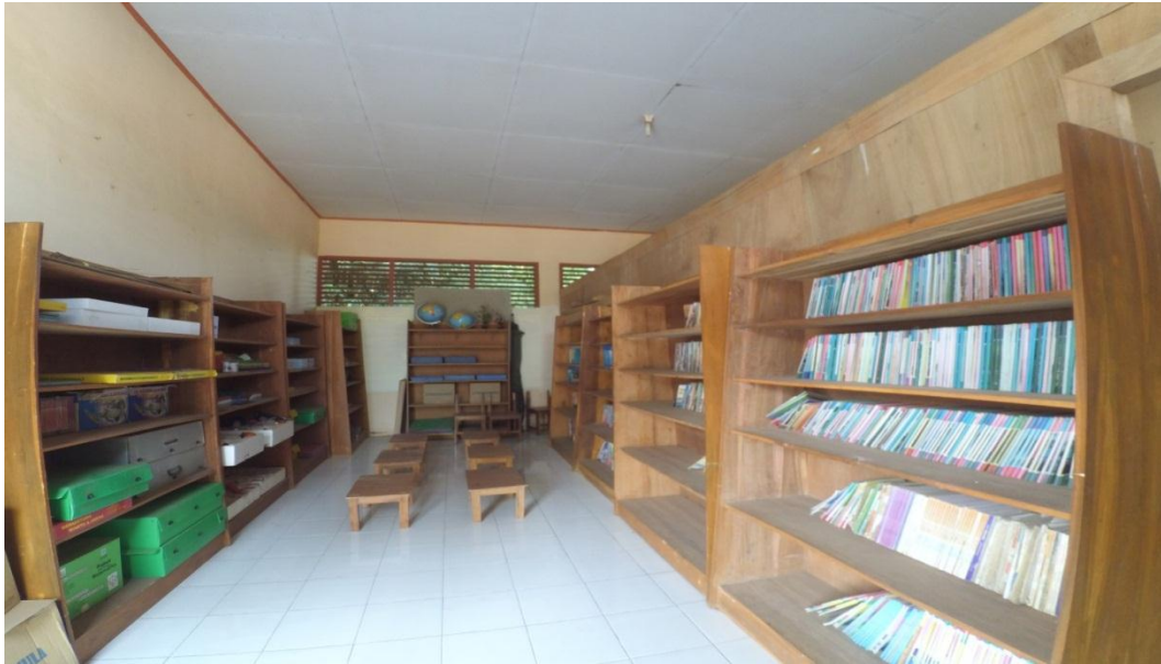
Lampiran 1. Gambar Ruang Baca