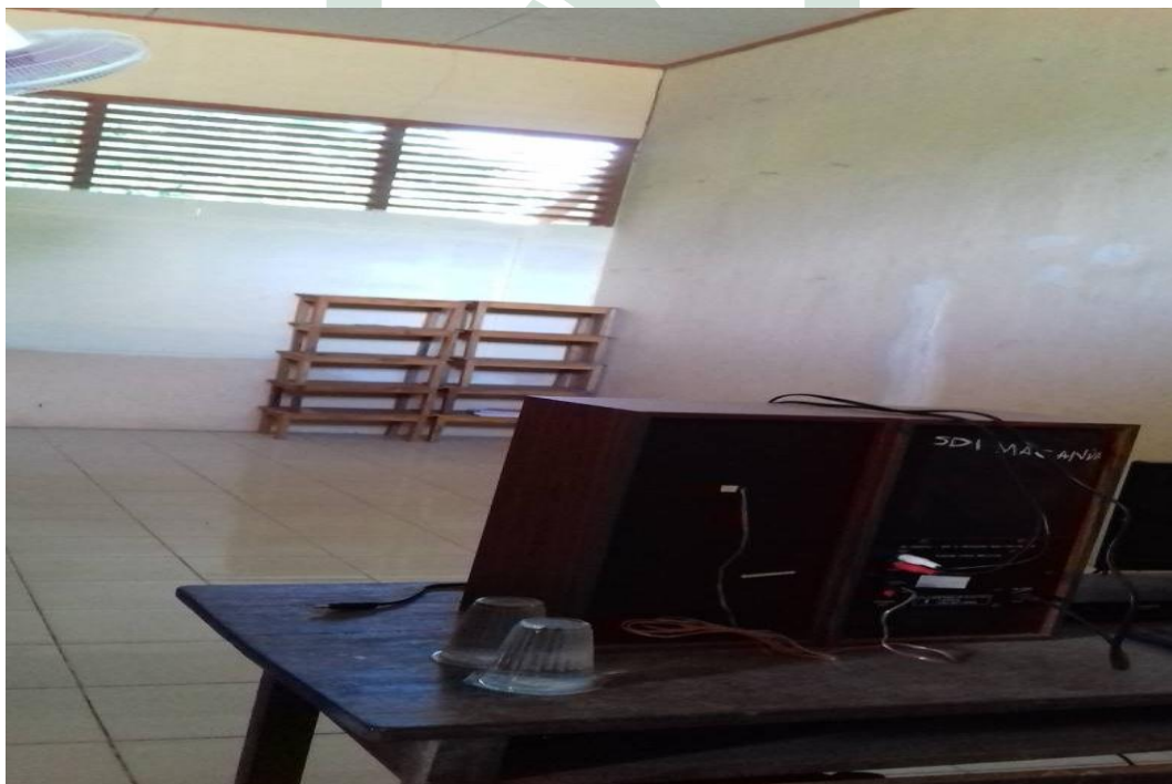
Lampiran 2. Gambar Ruang Shalat