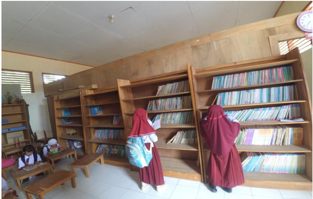
Lampiran 6. Gambar Pemanfaatan Koleksi

UNIVERSITAS ISLAM NEGERI ALAUDDIN M A K A S S A R