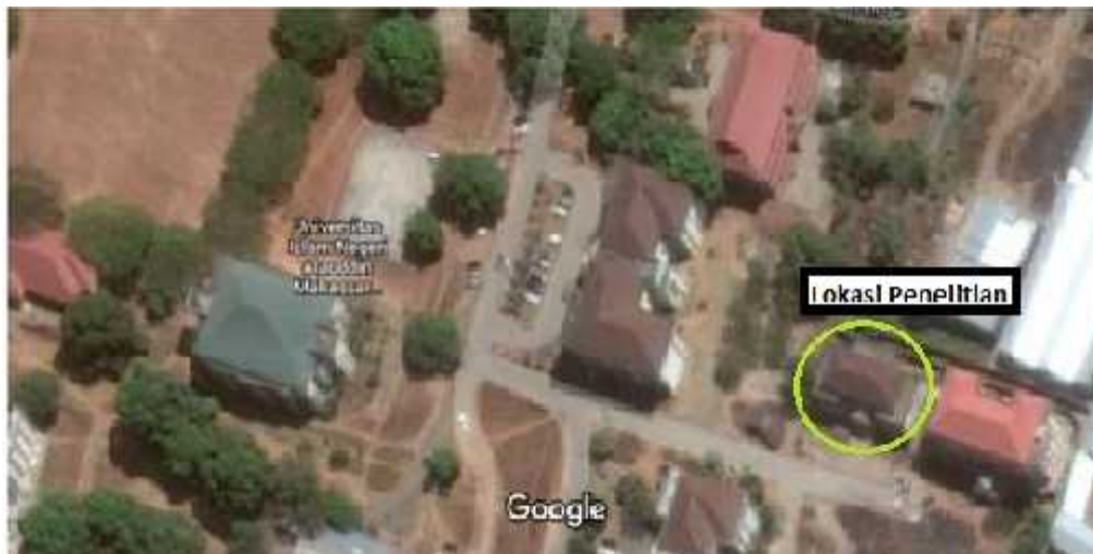
Gambar 3.1 Lokasi Penelitian

mengeluhan tentang keuntungan yang mereka peroleh tidak sesuai dengan di awal mereka memulai usaha.