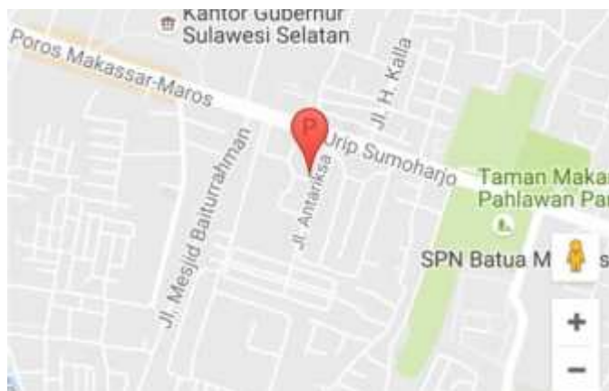
Gambar 1.2 Letak Geografis Kampung Rama

Rama atau Rantepao Makale terbentuk atas adanya kesepakatan dari beberapa tokoh di Kampung tersebut. Kampung Rama merupakan daerah yang berada di kota makassar tepatnya di bagian tengah antara Jln. Abdullah Daeng Sirua dengan Jln. Urip Sumiharjo di Kecamatan Panakkukang kelurahan Paroppo. Kampung Rama tersebut dikenal sebagai kampung masyarakat Toraja di kota Makassar, dimana kampung ini sangat di kenal dengan budaya Toraja, semua pernik pernik Toraja ada di kampung ini termasuk, tongkonan, warung makan khas toraja dan sebagainya. Menurut Ketua RW yang telah lama menetap di kampung ini mengatakan bahwa “sekitar 85% masyarakat di kampung ini merupakan orang-orang toraja”