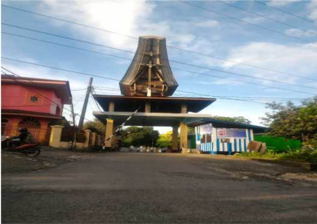
Gambar 1.1 Gerbang masuk di Kampung RAMA Kota Makassar