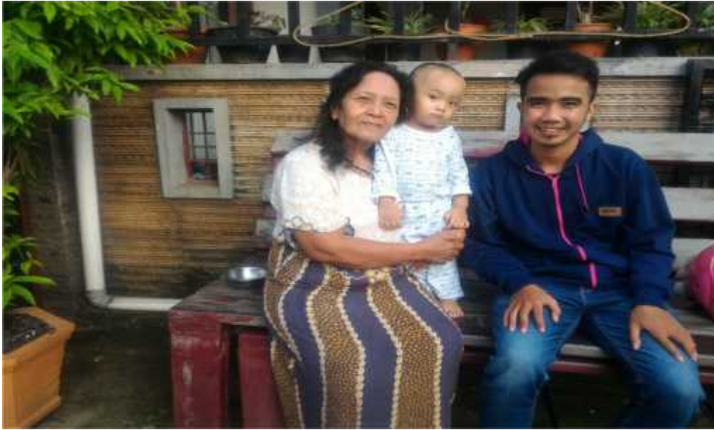
Gambar 1.3 Wawancara dengan Ibu dari Etnik Toraja