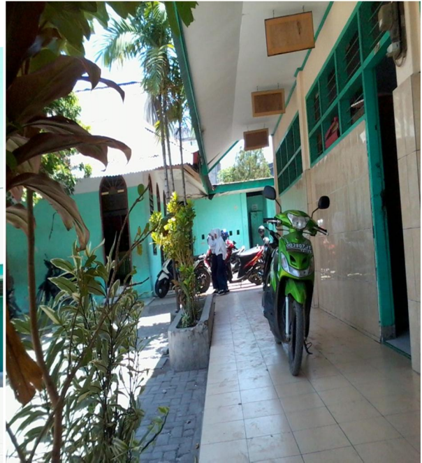
Ruangan kelas MI Darul Hikmah Kota Makassar