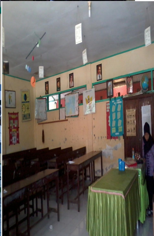
Beberapa media pembelajaran yang tersedia di dalam ruangan belajar peserta didik