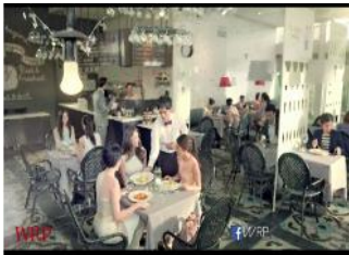
Tabel 4.1 Story Board Iklan WRP Edisi Diet Gampang dan Sehat