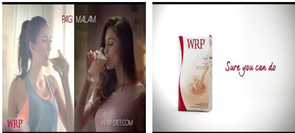
Gambar 4. 4 Gambar Produk Susu WRP

Pada scene keempat, kelima dan keenam iklan ini, menampilkan setting lokasi dalam rumah (indoor) dengan 1 ikon perempuan sebagai pemeran, serta menampilkan produk iklan susu diet WRP. Setting adegan iklan dalam rumah tersebut memperagakan seorang perempuan yang sedang mengkonsumsi susu diet WRP di pagi hari dan malam hari. Selanjutnya produk susu diet WRP ditampilkan beserta taglinenya, yaitu “ sure you can do ”. Berikut gambaran visual yang ditampilkan pada scene 4 iklan susu diet WRP edisi diet gampang dan sehat :