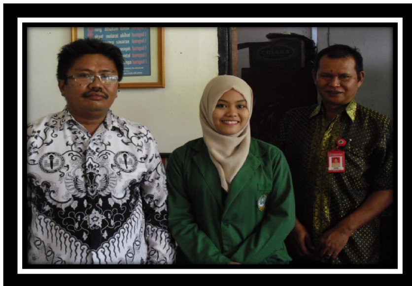
Wakil Kepala Sekolah (kiri) dan Kepala TU (kanan)