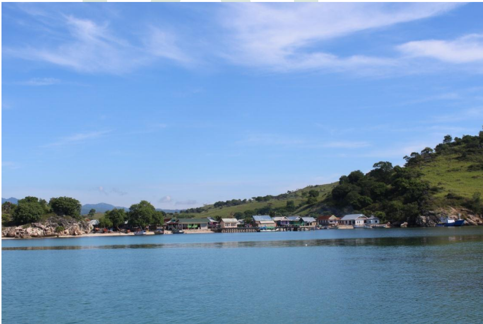
Bajo bagian Timur