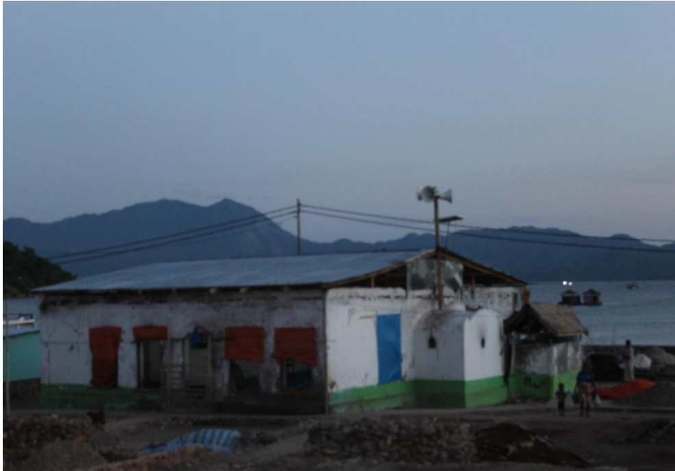
Masjid Nurul Hidayah Bajo Tengah