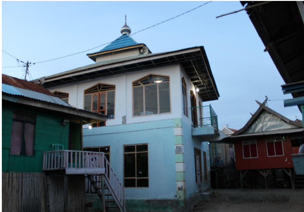
Masjid Bajo Barat