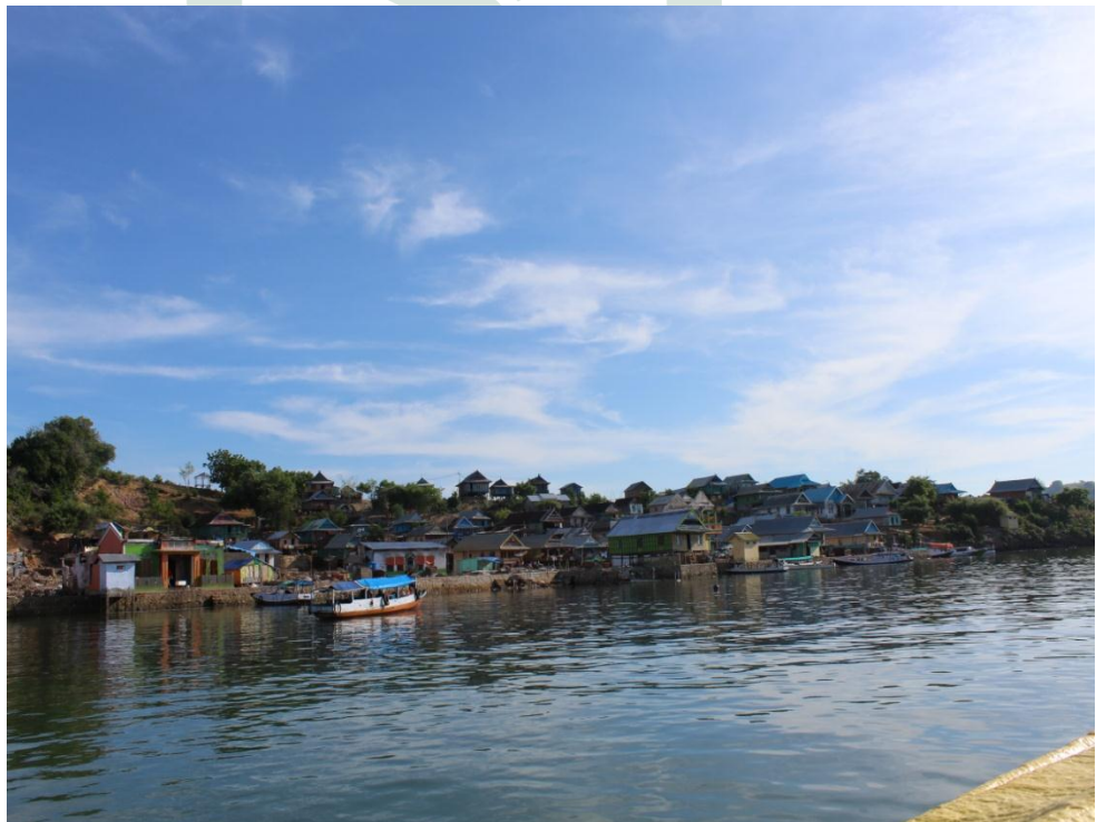
Bajo bagian Tengah