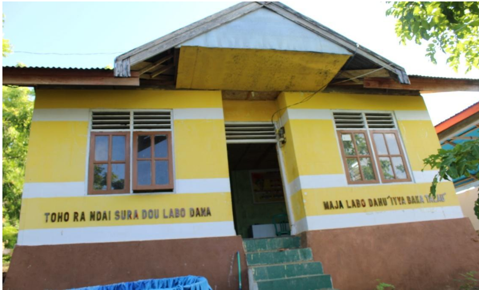
Kantor Desa Bajo Pulau