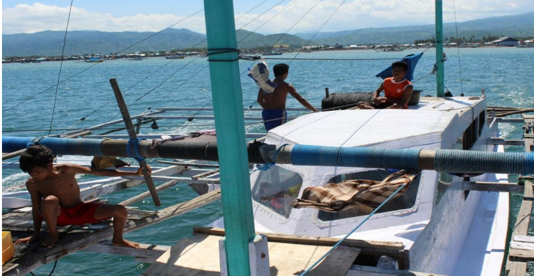
Bagang yang saya pake untuk masuk ke Bajo Pulau