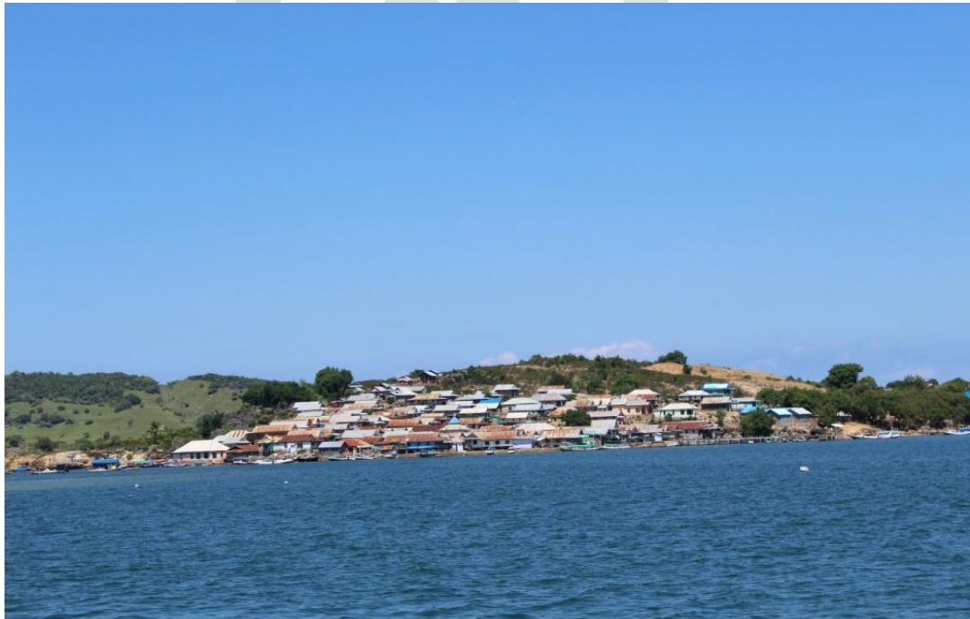
Bajo bagian Barat